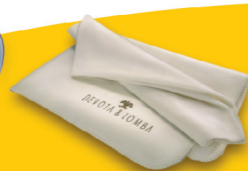
Manta polar Devota & Lomba