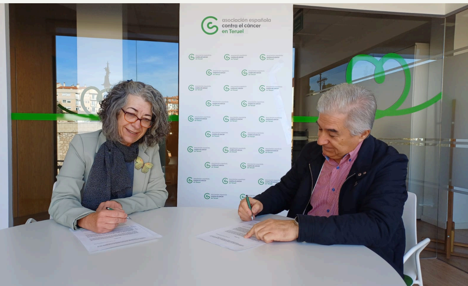
Momento de la firma del acuerdo entre el COE de Teruel y la AECC

Puedes ver más sobre el acuerdo pinchando aquí .