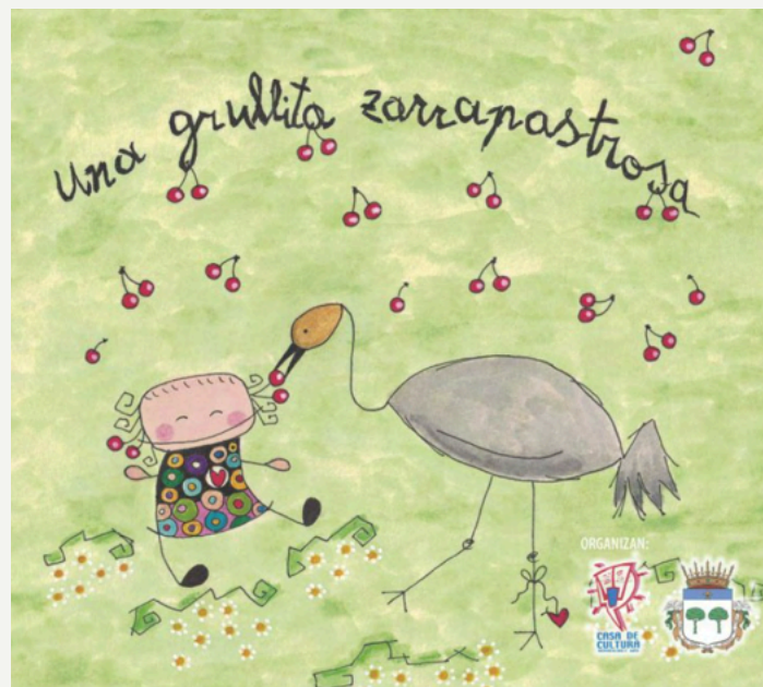
Portada de “Una grullita zarrapastrosa”.

Pilar comenzaba diciendo que no es inspiradora, pero sin duda, y en la entrevista hemos podido comprobar que su actitud, su generosidad y su espíritu inspiran, son los de una enfermera, pero Pilar, es más que enfermera.