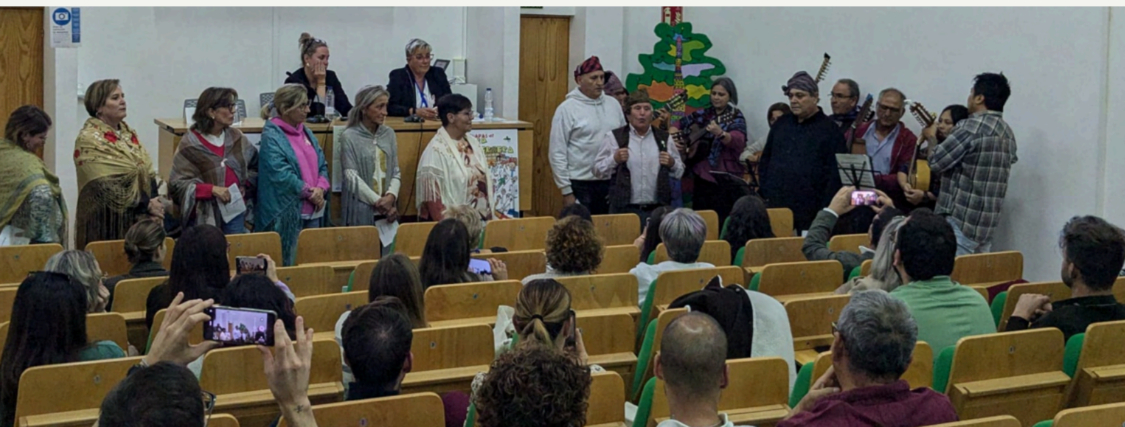
Imagen de la clausura con el grupo jotero que personalizó las tradicionales jotas con temática enfermera.

Con los talleres y ponencias del programa , los participantes pudieron actualizar sus conocimientos y