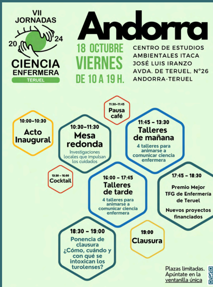
cartel de las VII Jornadas con el resumen de actos del programa.

A través de entrevistas, perfiles y relatos cautivadores, "Inspiración Enfermera" busca resaltar la diversidad de roles y contribuciones que nuestras enfermeras desempeñan en la salud comunitaria.