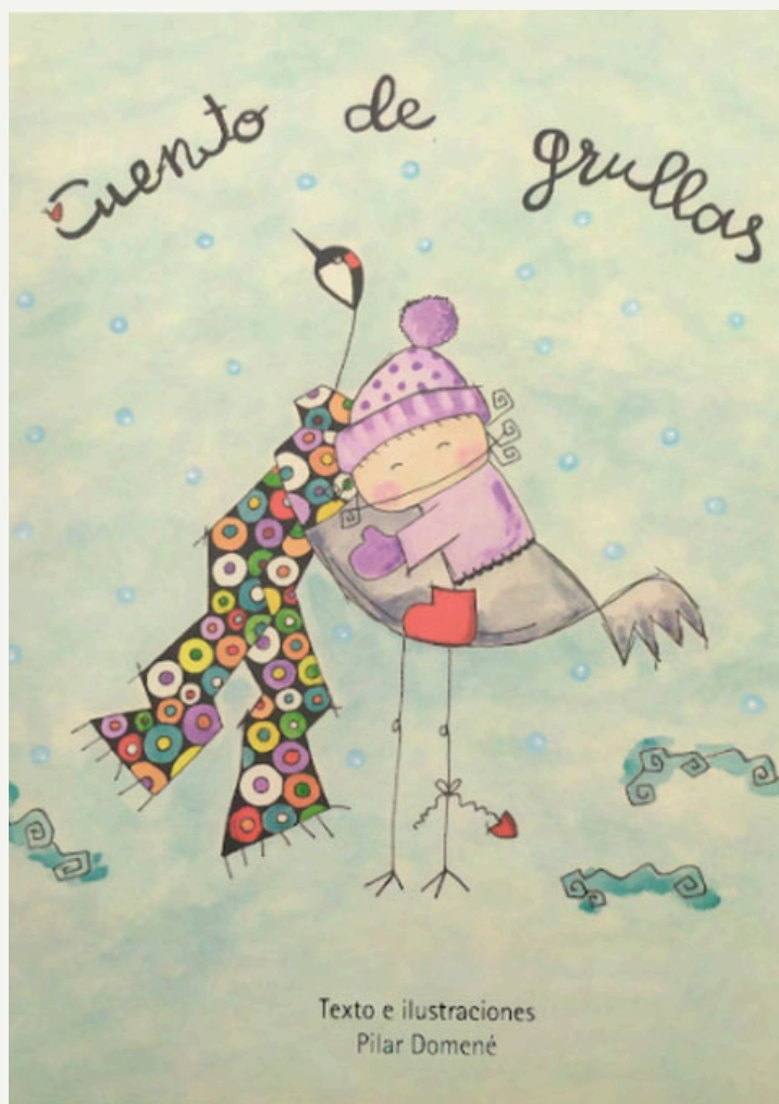
Imagen de portada de Cuento de Grullas publicada en Internet.

El cuento de las grullas no solo fue un proyecto personal, sino que se convirtió en un éxito compartido. Pilar lo ilustró y presentó en diversos colegios y centros culturales, y fue acogido con mucho