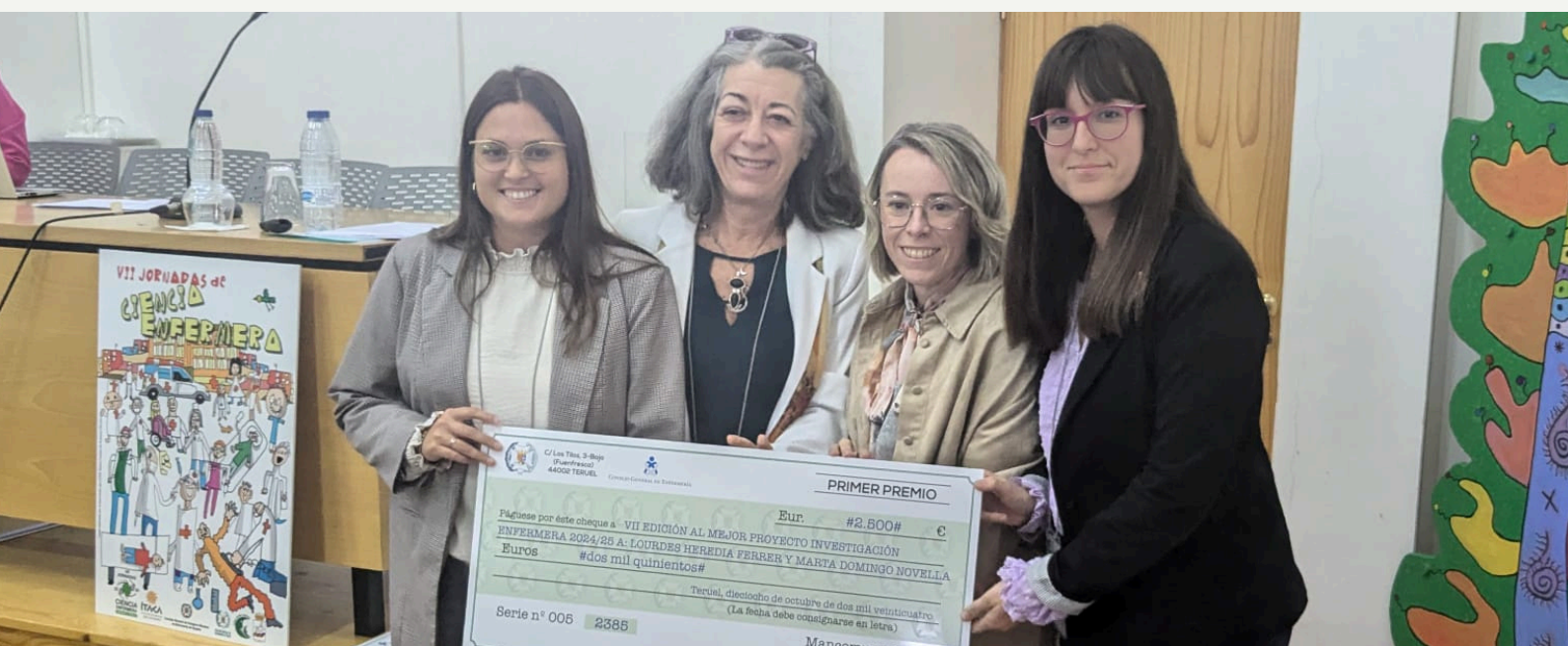
Entrega de premio de las VII Jornadas de Ciencia Enfermera

Lourdes Heredia también ve el gran potencial de la IA, sobre todo en "tareas administrativas y de análisis" , lo que puede liberar a los investigadores de la carga operativa y permitirles centrarse en el análisis crítico